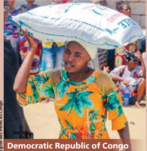
Eglise des Freres au Congo

■ Subvenciones importantes del Emergency Disaster Fund apoyaron programas de ayuda y recuperación en zonas de conflicto que afectan a los Hermanos en Democratic Republic of Congo, Nigeria y South Sudan.