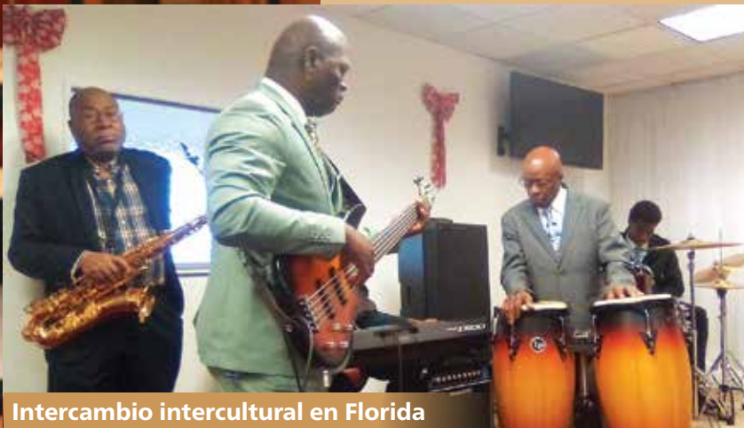
Intercambio intercultural en Florida

■ Una iniciativa financiada con subvención sobre iglesias rurales y de pequeños pueblos se lanzó en asociación con Ashland Theological Seminary.