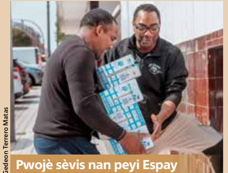
Pwojè sèvis nan peyi Espay

■ Lidè yo nan legliz la nan US ranfòse relasyon nan vizit nan legliz sè yo nan yon nonb de peyi yo, ki