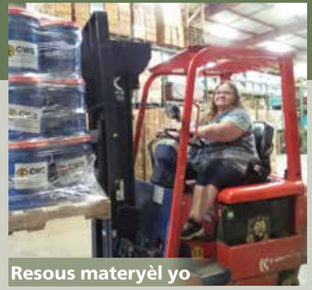
Resous materyèl yo