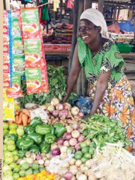
Pwogram mikrofinans nan Burundi

■ Pwojè nan sèt peyi benefisye de Inisyativ Manje Global la. Sibvansyon sipòte moulen grenn jaden yo, dlo pwòp, fòmasyon ekstansyon agrikòl, jaden lekòl ak edikasyon nitrisyon, ak pwojè agrikòl ki baze sou legliz.