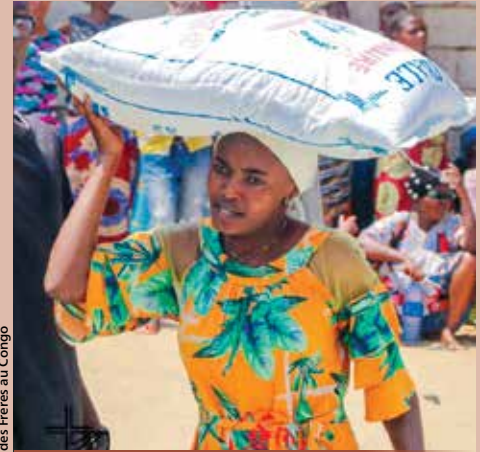
Eglise des Freres au Congo

■ Gwo sibvansyon ki te fèt nan Fon pou katastwòf Ijans sipòte pwogram sekou ak rekiperasyon nan zòn konfli ki afekte frè yo nan Repiblik Demokratik Kongo, Nijerya ak Soudan Sid.