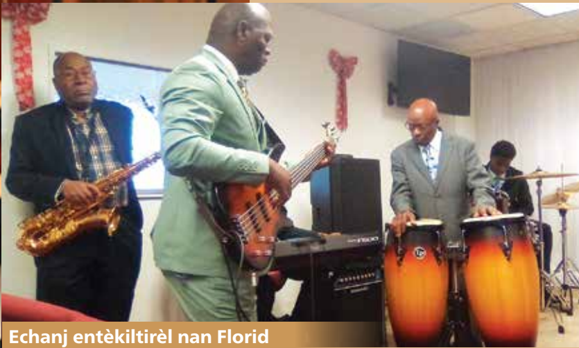
Echanj entèkiltirèl nan Florid

■ Misyon ak Ministè Komisyon Konsèy la te pale sou depòtasyon imigran, transfè zam ak vyolans zam.